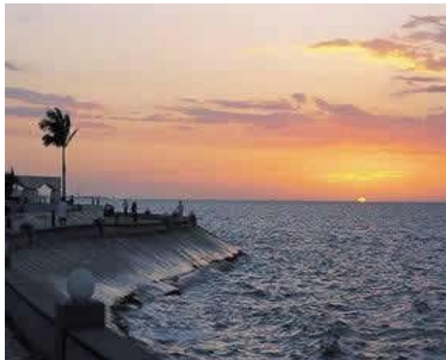
PUESTA DE SOL EN CAMPECHE, CAMPECHE

Los requisitos del 1 al 5 se presentan en dos copias, y el no. 6 en tres copias.